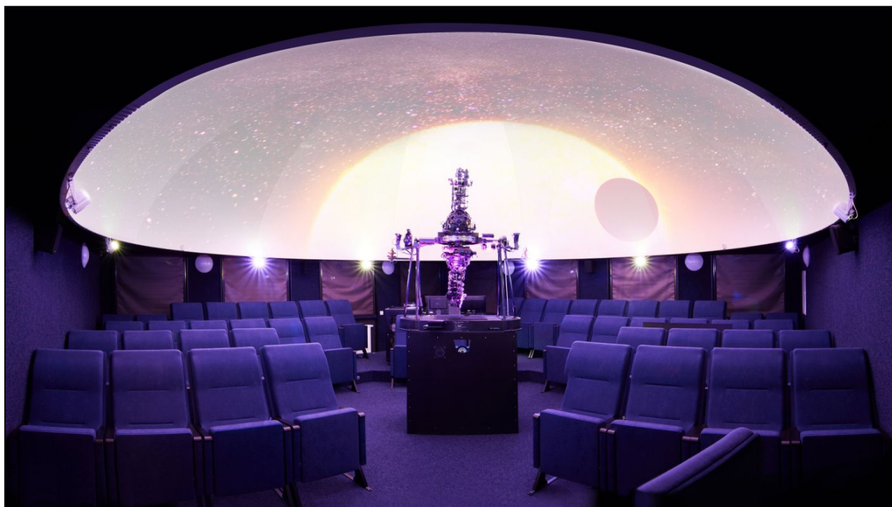
Hvězdný sál planetária Jazykového a komunikačního centra Gymnázia Cheb

Škola má také svoji vlastní hvězdárnu s počítačem řízeným dalekohledem o průměru hlavního zrcadla 30 cm; v interiéru i exteriéru školy je rozmístěno množství názorných interaktivních exponátů, které vytváří malé science centrum.